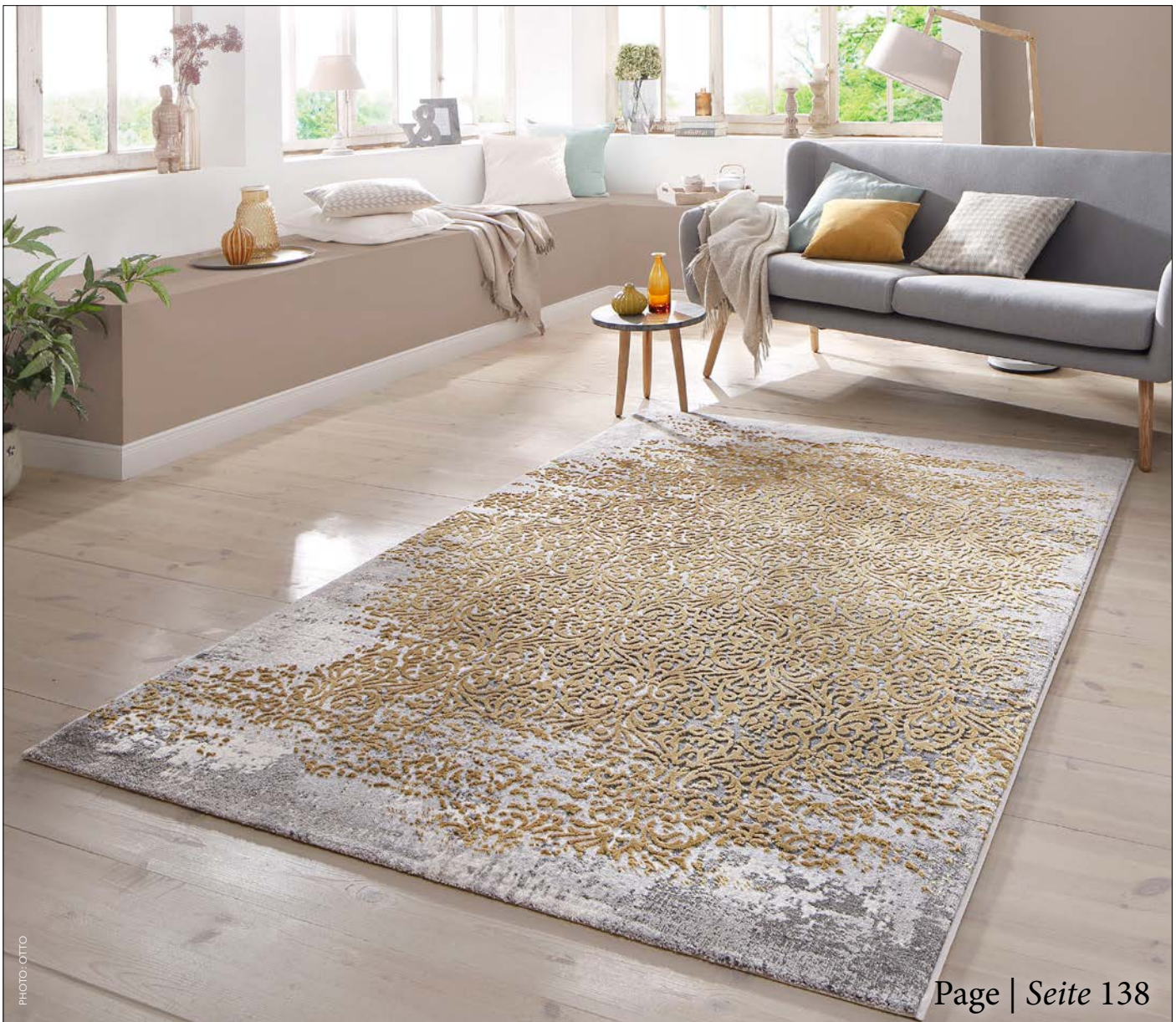
Page | Seite 138