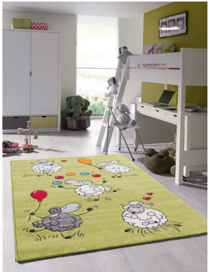
Diamond Kids. Merinos / Medipa

Klar, dass bei Neuentwicklungen die Garne einen hohen Stellenwert einnehmen. Sehr beliebt ist bei Merinos zurzeit eine hochwertige, besonders weiche Polypropylen-Ware. Durch die aufwendigere Herstellung ist das Produkt allerdings kostenintensiver und insofern auch erklärungsbedürftiger. "Bei solchen Neuheiten müssen wir ein bisschen Geduld mitbringen, bis der Handel und letztlich der Endverbraucher sie annimmt. Aber das Warten lohnt sich." Gern experimentiert die Entwicklungsabteilung mit Kombinationen aus verschiedenen Fasern und Garnen. Auch hier ist die eigene Garnproduktion von Vorteil, die sehr flexibel auf verschiedene Anforderungen reagieren kann. >