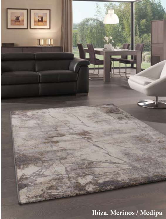
Ibiza. Merinos / Medipa

lypropylen mit rund 80 % auf dem europäischen Markt den weitaus größten Anteil aus, gefolgt von Acryl mit 10 %; Polyester liegt derzeit noch bei rund 10 %. Aber das wird laut Kepekci nicht so bleiben: "Wir rechnen hier mit großen Zuwächsen, vor allem bei den weichen Microfaserteppichen." In Sachen Polypropylen ist Merinos bereits hervorragend aufgestellt: In und um Gaziantep produzieren mehrere eigene Werke das beliebte Garn.