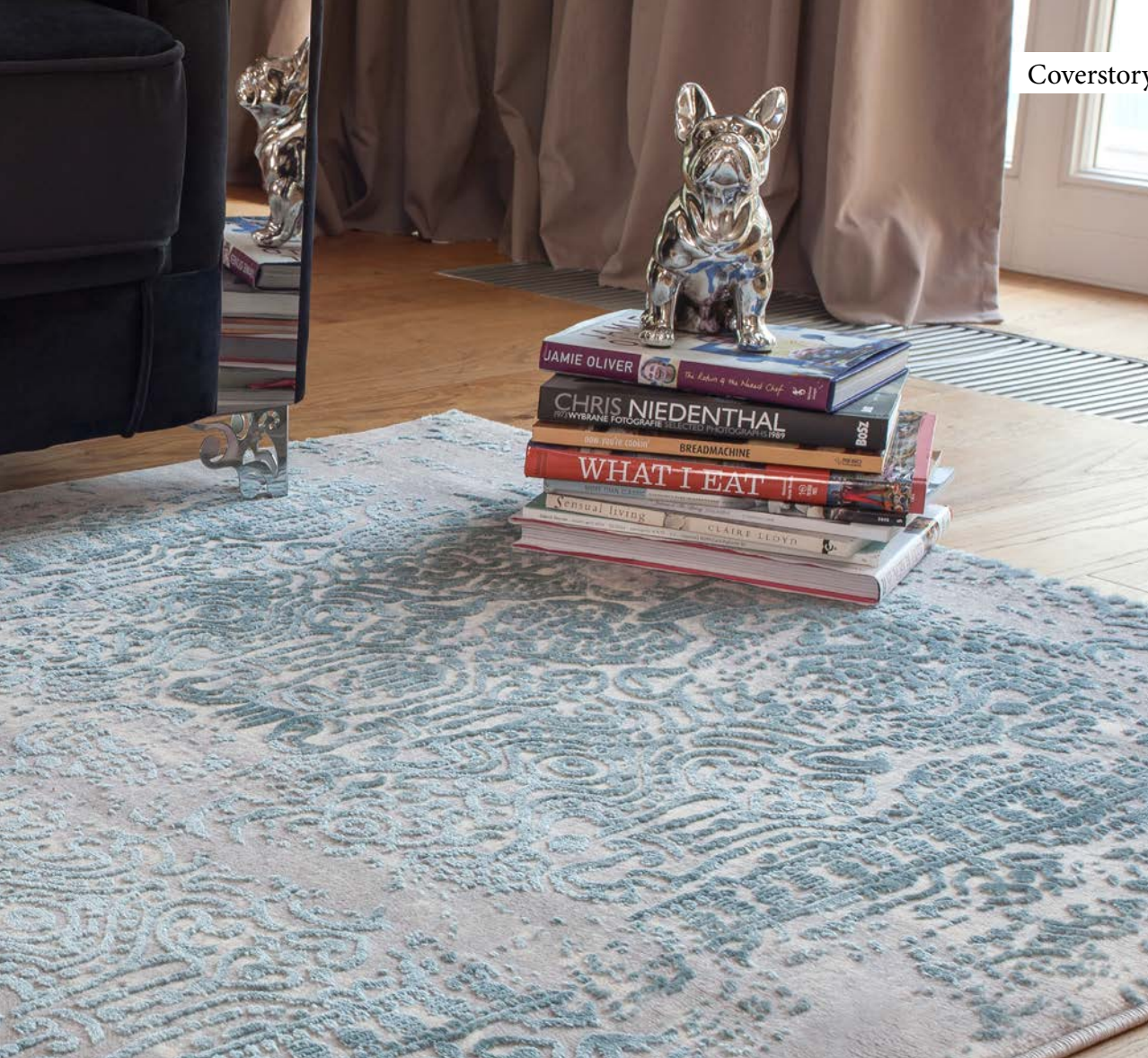
Thema. Merinos / Medipa

M erinos carpets can be found at many large carpet dealers: sometimes under the manufacturer's name; sometimes as an own brand. The distribution subsidiary Medipa Handels GmbH at the Troisdorf site has established itself in Central Europe in recent years and has a good reputation. Behind the broad, fast-rotating and constantly changing product range is a well-networked development team from different production sectors, ranging from yarn manufacture and weaving to finishing.