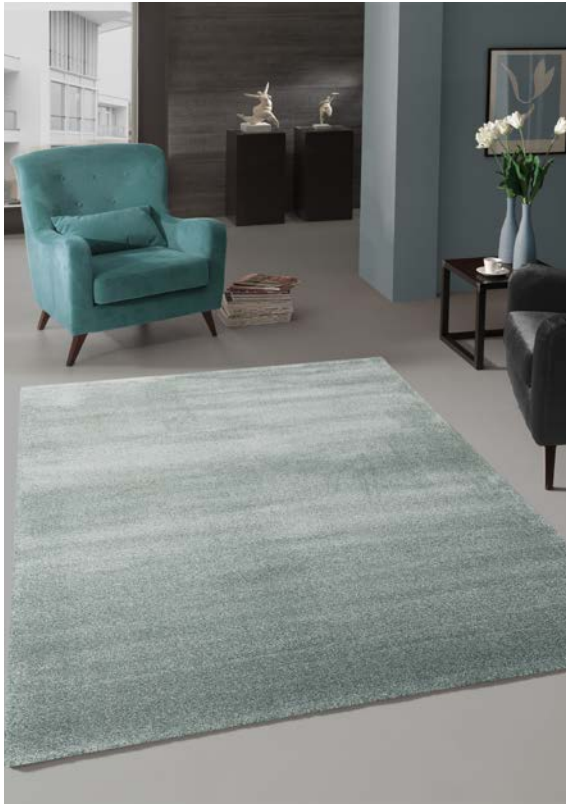
Topas. Merinos / Medipa

So sind beispielsweise die sehr plastischen Kollektionen Ibiza und Thema entstanden, die PP-Heatset- und Polyester-Schrumpfgarne miteinander kombinieren und die bei Merinos zurzeit stark im Fokus stehen. Die Kombination unterschiedlicher Materialien erzeugt bewegte Hoch-Tief-Strukturen und ein lebhaftes Farbspiel. Mal hell und dezent (bei Ibiza) und mal farbenfroher und klassisch-floral (Thema). Nachdem der Verkauf zunächst etwas zögerlich angelaufen sei, seien die Kollektionen in den letzten Monaten "durch die Decke gegangen". Entsprechend sieht Merinos in diesem Bereich noch viel Potenzial.