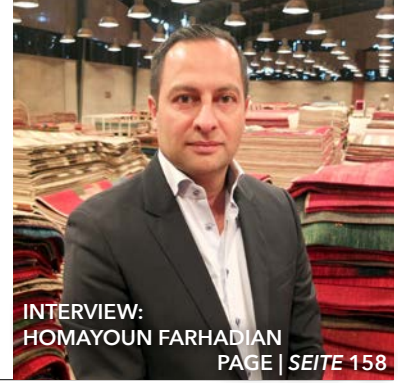
INTERVIEW: HOMAYOUN FARHADIAN PAGE | SEITE 158

International Business Magazine for Carpets & Rugs Internationales Wirtschaftsmagazin für Teppiche